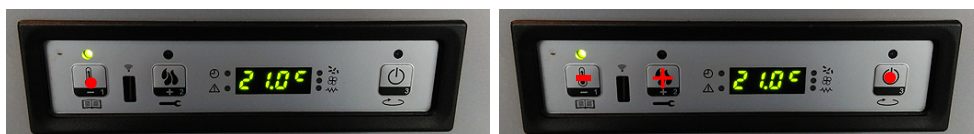
Zmiana temperatury - nacisnąć P1, zaświci się LED, zmiana - przyciski P1 i P2, zatwierdzenie P3

Piecyk przejdzie do fazy rozpalania - najpierw wentylator wyciągowy oczyszcza palenisko, następnie podany zostanie pellet i rozpalarka spowoduje rozpaleni pelletu. Faza rozpalania może trwać od 4 do 15 minut.